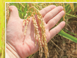
収穫期を迎えた「福、笑い」 有機栽培で美しく色づいた稲穂