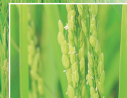
穂ぞろい期を迎え、次々と開花する「福、笑い」の稲の花。