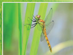
環境負荷を減らした持続可能な米づくり