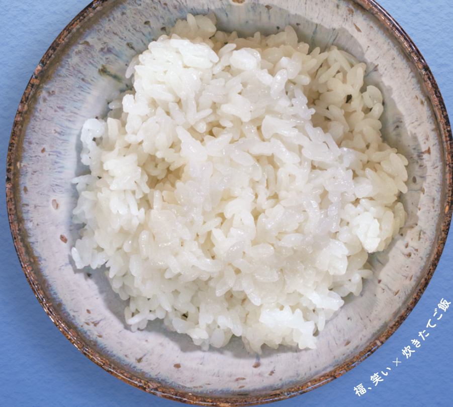
福、笑い × 炊きたてご飯